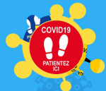
STICKERS D'INDICATION PERSONNALISÉS AVEC LOGO