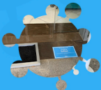
SUPPRESSION DES RIDEAUX ET TAPIS