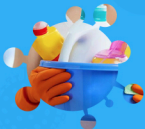
ACHAT DES PRODUITS CONFORMES AUX NORMES EXIGÉES