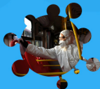
DÉSINFECTION DES BUS